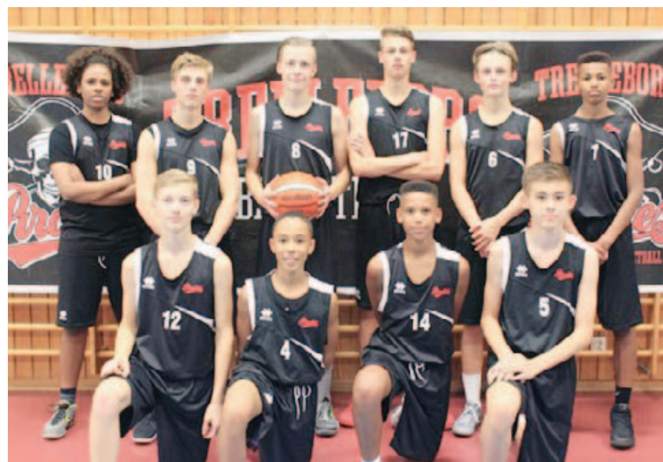
Pirates talangfulla PU16-lag som i helgen kan bli ett av Sveriges fyra bästa i sin ålderskategori.

– Men vi hade AIK i gruppen och de är ganska outstanding i den här ål-